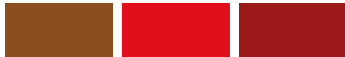
721 Nocciola 521 720 Rosso vivo (Tipo RAL 3000) 520 726 Rosso Pompei 526