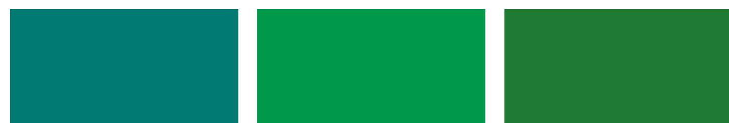
710 Verde Persiana 510 716 Verde Bandiera 516 722 Verde Foglia 522