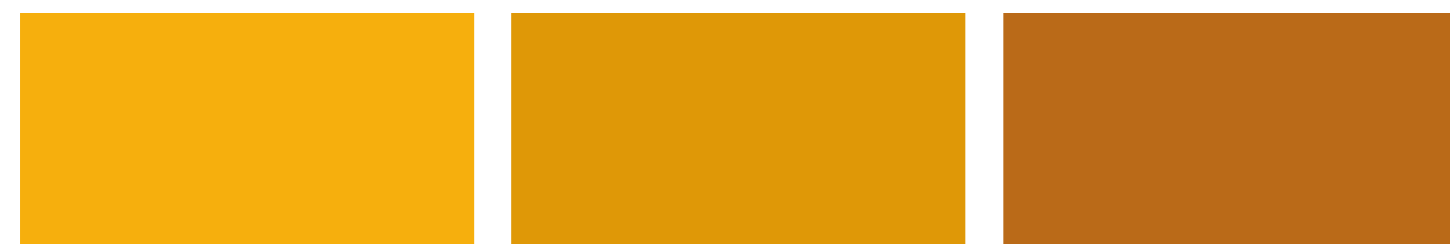
732 Giallo Dorato 532 711 Giallo Ocra 511 709 Camoscio 509