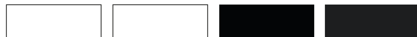
800 Bianco Satinato 1800 Bianco Opaco 1900 Nero Satinato 2900 Nero Opaco