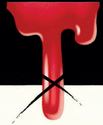
001 Bianco Lucido